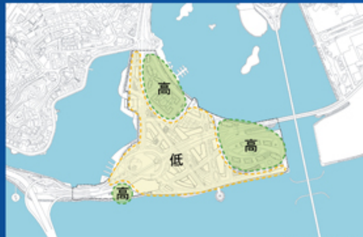
C、D區建築高度分區圖