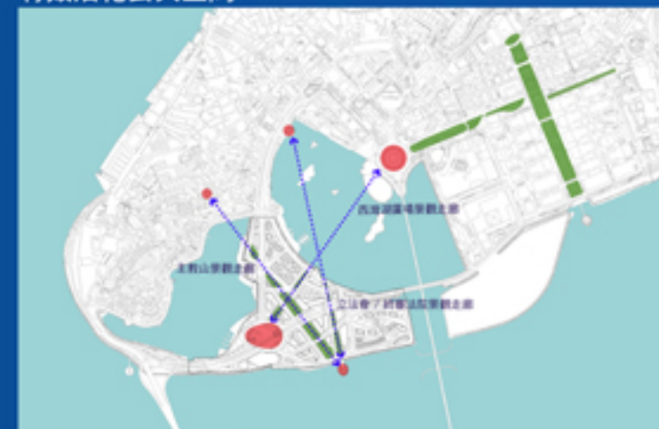
建議中的景觀綠化走廊