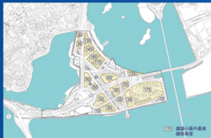
C、D區地段高度建議圖