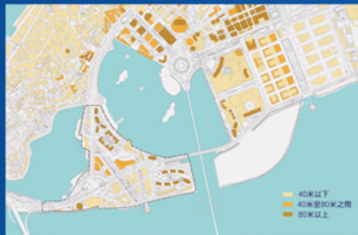
C、D區與現有建築高度關係圖